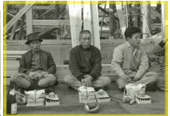
(若かり頃の先代社長親父の時)

小学生の頃は夏休みとかに掃除片付けの お手伝いです。大工さんがかんなをかき取り のみを使って木に穴を開けたり、のこぎりで木 を切り取りするのを見ておりました。